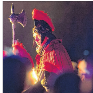
Als Martin verkleidet: Martinsumzug in Berlin

Die Menschen erzählen sich, dass Martin sich zuerst nicht würdig fühlte für das Bischofsamt. Er versteckte sich in einem Gänsestall, um nicht Bischof werden zu müssen. Aber die Tiere schnatterten so laut, dass Martin entdeckt wurde. Noch heute essen viele Menschen eine Martinsgans, wenn der 11. November im Kalender steht. (KNA/llo)